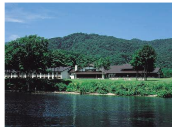
▲十和田プリンスホテル(イメージ)