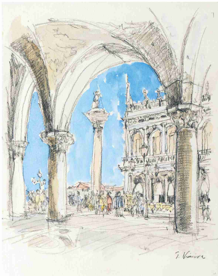
木村 とある 利「活力あるサンマルコ広場」