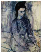
猪熊弦一郎「マドモアゼルM」/1940年 油彩・カンヴァス、81.2×65.4cm 猪熊弦一郎昭和第1回油画発表展(1941年)