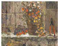
「厩屋」 2007年/油彩・カンヴァス/F100号 第74回東光展会員賞