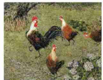
「庭に遊ぶ」 2022年/油彩・カンヴァス/F100号 第9回改組新日展