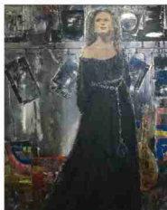
河野磐「リハーサルの日」 油彩・カンヴァス/F10号 1978年東光展/河野美術館蔵

※編集者注 河野美術館 〒708-0835 津山市勝間田町16 http://tsuyama-city.musicfactor.jp/kouno/