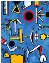
猪熊弦一郎「金環画」/1987年 アクリル・カンヴァス 152.0×120.9cm