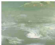
奥村土牛「鳴門」 1950年 紙本・彩色・軸装 128.5×160.5cm 山極美術館蔵