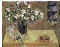
「卓上静物」 1995年/油彩・カンヴァス/F100号 第27回日展

イーゼルに掛かっていた制作中の絵は、5月の東光会に出展する100号の作品。うしろの壁には、尊敬する東光会の森田茂先生、佐藤哲先生、江藤哲先生の3人の展覧会ポスターが貼ってあった。「私もこんな絵が描けたらいいと思って」。