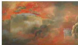
木村武山「阿房劫火」/1907年/絹本・彩色・軸装 141×240.8cm/第1回文展3等賞/茨城県近代美術館蔵