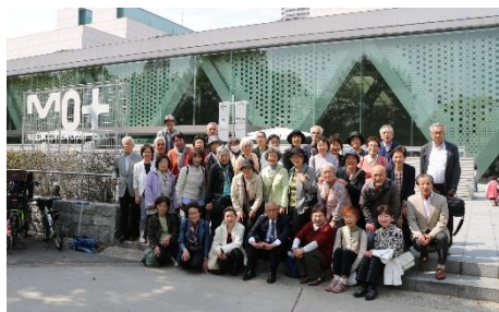
東京都現代美術館