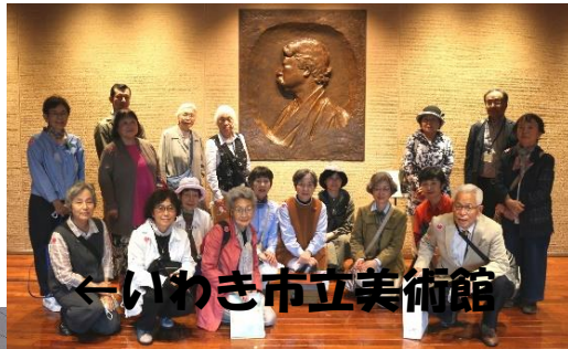
←いわき市立美術館