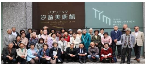
パナソニック汐留美術館