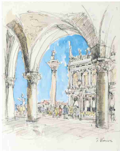
木村 利 きむら り 「活力あるサンマルコ広場」