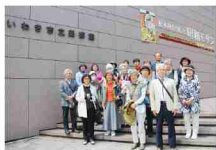
参加会員 いわき市立美術館