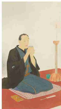
鏡木清方『三遊亭円朝像』 1930年 絹本彩色・軸 138.5×76.0cm 東京国立近代美術館蔵 重要文化財 ©Akio Nemoto

今年7月の初旬、私は東京で見損ねた『鏡木清方展』を追いかけて京都国立近代美術館まで足を運んだ。猛暑の到来を予感させるねっとりとした蒸し暑い一日だった。目的は清方の代表作『築地明石町』。浅黄色の小紋の着物に黒羽織り。ちよいと振り向く女性の姿が粋である。もう一枚見たかったのが『三遊亭円朝像』。落語好きにはあまりにも有名な落語の神様。幕末明治に活躍した噺家で、人情話の『芝浜』、怪談『牡丹燈籠』、海外文学の翻案『死神』等傑作揃い。今でも数多の噺家が挑戦する。清方の父親と円朝の交流が深く、清方は思い出の中の円朝を描いている。高座に上がり正面を見つめ茶をすすする姿は、これから始まる一席を固唾をのんで見守る観客の緊張感も伝わってくる。