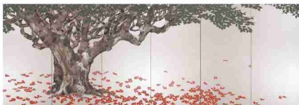
右隻 牧進「再喜樹宴」 1994年／紙本彩色・六曲一双屏風／215×600cm／成川美術館蔵