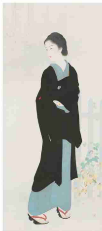
鏡木清方『築地明石町』 1927年 絹本彩色・軸 173.5×74.0cm 東京国立近代美術館蔵

そんな折、別の仲間から、「寄席」を作ろうという悪魔のささやきが。ふたつ返事で答えてしまったのが苦勞の始まり。それでも今年