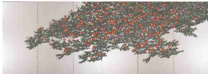
左隻 牧進「再喜樹宴」 1994年／紙本彩色・六曲一双屏風／215×600cm／成川美術館蔵