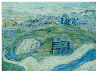
松本竣介「盛岡風景」1941年・油彩・カンヴァス/53.2×72.8cm 岩手県立美術館蔵