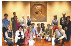
参加会員及び井野高席宇芸員(後列左から2人目) 天心記念五浦美術館