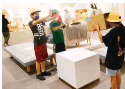
展示会場での子どもたち