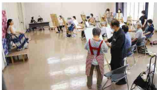
絵画講習会風景(2022年7月22日) 美術館講座室