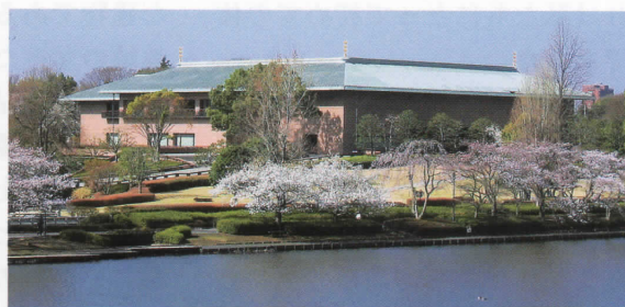
千波湖から眺めた茨城県近代美術館

このまま、この会長に任せてはこの先が心配と皆様が思われ、これまで以上に会の行事に参加され、会員をおひとりでも連れてきていただければ望外の幸せでございます。会員の皆様はじめ美術館の方々、本誌に目を通された方がたの倍旧のご協力とご支援を重ねてお願いしご挨拶とさせていただきます。