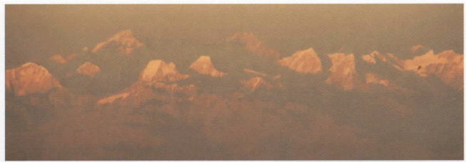
ヒマラヤ夕照(機中より)