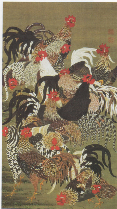
伊藤若冲「動植綵絵」の内「群鶏図」 1761-1765年頃 絹本着色 一幅／142.6×79.7cm 宮内庁三の丸尚蔵館蔵