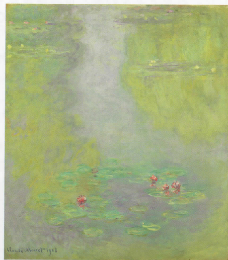
クロード・モネ「睡蓮」 1908年／油彩・カンヴァス／101×90cm 東京富士美術館蔵