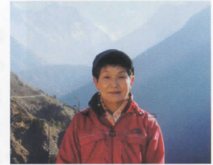
エベレストビューホテル テラスにて

ライトできるはずの飛行機が遅れて、搭乗は夕刻になっていた。カトマンズのドリッパン空港を飛び立ってまもなく視界に飛び込んできたのは、まるで空中に浮かんでいるかのような、夕日に染まって輝くヒマラヤの峰々であった。人間には成しえない比類なく美しく神々しい造形。飛行機を待って何時間も過ごした無為な時間は、この幸運な瞬間に立ち会うべくあったのだと思えた。世界に冠たるヒマラヤの風を纏って生きる人々には、厳しい現実を乗り越え、誇り高く生きて欲しいと願いつつ帰国の途についた。