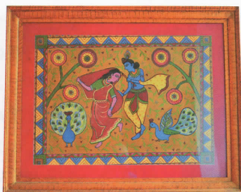
ミュージアムの作品