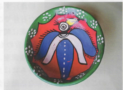
「女性開発センター」の婦人たちの作品(小皿)